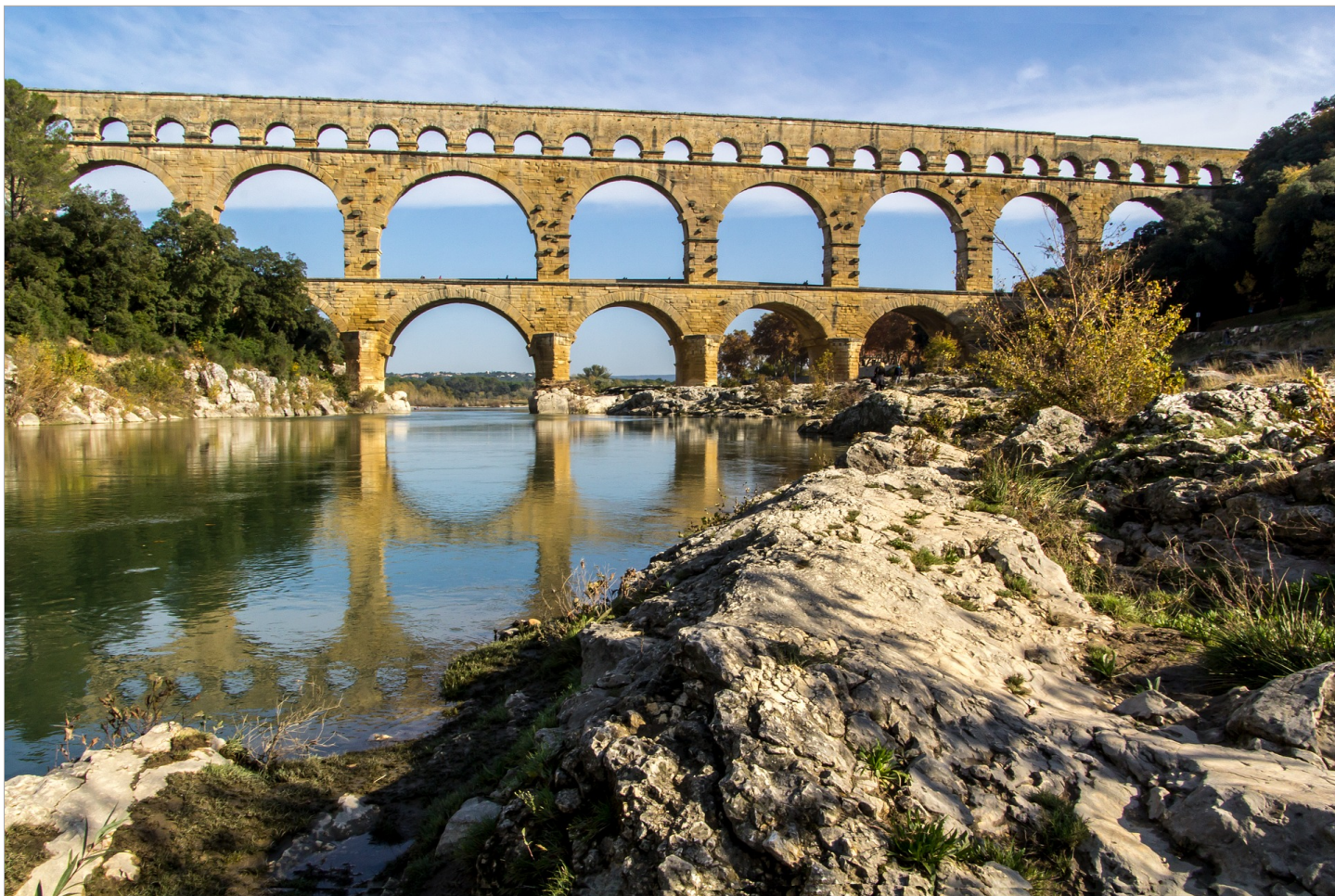
Древнеримский акведук Пон-дю-Гар. Построен в I веке н.э.